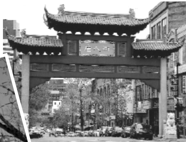
ARCHE DANS LE QUARTIER CHINOIS